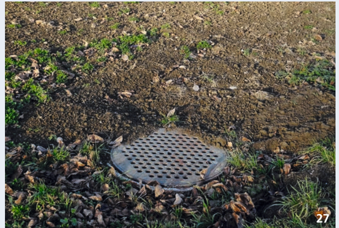
Der Schacht hat keinen oder einen undichten Deckel. Wasser aus dem Feld und erodierte Erde können in den Schacht gelangen.