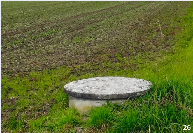
Der Schacht ist mit einem Deckel verschlossen. Der Schachtdeckel ist intakt und weist keine Löcher oder Risse auf.